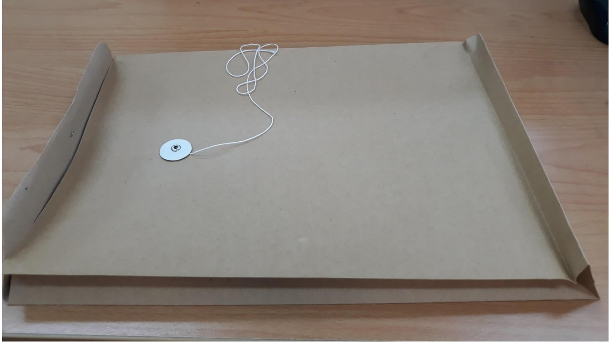
Hình minh họa: bì hồ sơ cần in