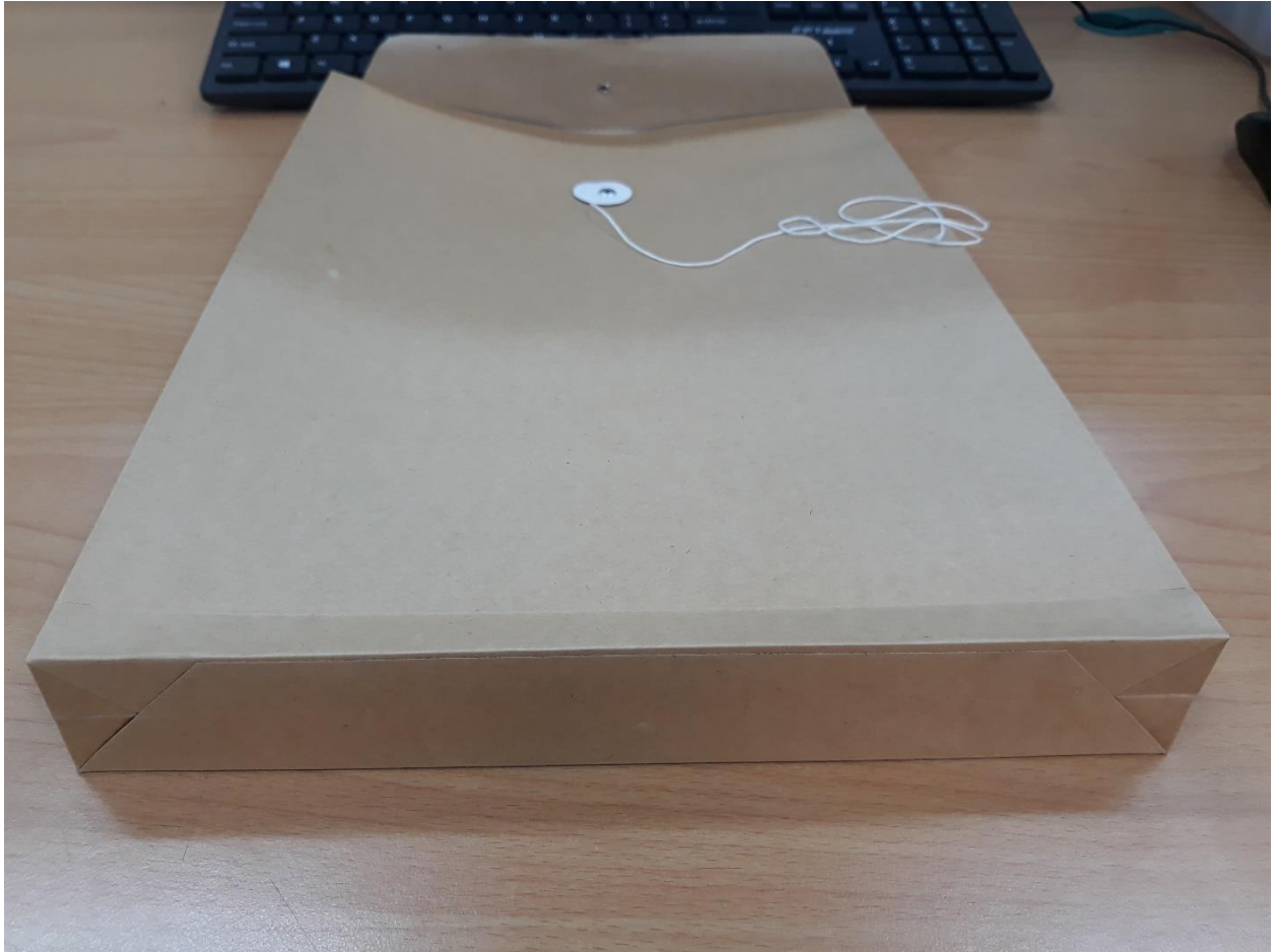
Hình minh họa: bì hồ sơ cần in