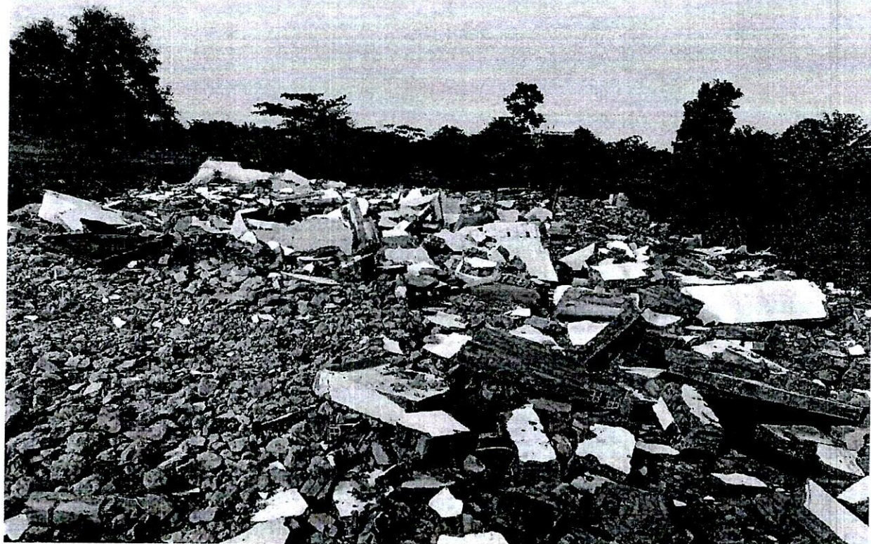
Hình ảnh: Xà bần (hộ ông Huỳnh) cần dọn dẹp và vận chuyển về Trường