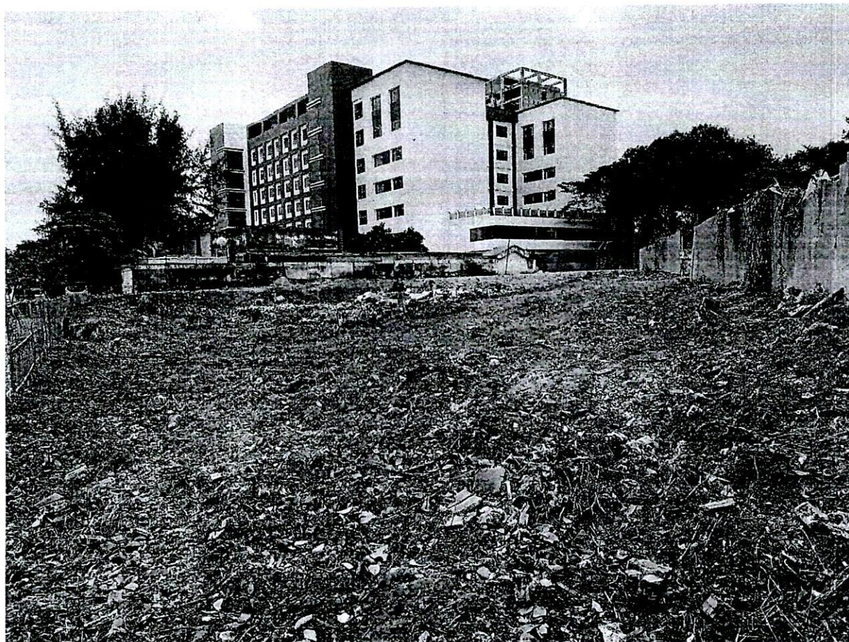
Hình ảnh: Hình ảnh khu vực trống mới giải tỏa căn vận chuyển xà bần (hộ ông Huỳnh) về để san lấp.